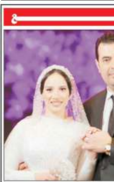
مشهد من مسلسل «المعلم».