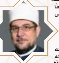
د. محمد مختار جمعة وزير الأوقاف