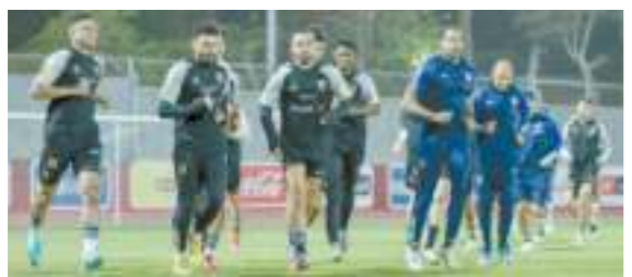
أمام إنبي بالدوري

الأهلي المنتشي أفريقيا يسعى لتصحيح المسار محلياً الرياضة ... ص 15-16