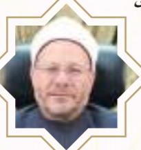
د. شوقي علام مفتي الجمهورية

منهجية لا تعرف التكفير إن سلوك طريق التكفير حيال المؤمنين وتكثير أسبابه عمل يخالف المسلك النبوي، الذي دللت عليه النصوص الشرعية من إحسان الظن والإمساك عن تكفير كل من نطق بالشهادتين. إن الحكم بتكفير أي إنسان لا يكون إلا عن طريق القضاء، ولا يتم إلا بعد التحقق الدقيق من الأمر، ولا يجوز لأحد من الناس أن يكفر أحدا، والأزهر الشريف على مدار تاريخه اعتمد على منهجية متضبطة، استتبت لتعايش الحقيقي بين أبناء المجتمعات، وهي، لا الإقصاء ولا التكفير، بجانب تهذيب النفس الإنسانية مع العلوم الشرعية، فلا بد من تهذيب الجانب الأخلاقي الخاص بتهذيب النفوس باعتبارها مكونا أساسيا من المنهجية الأزهرية المتضبطة التي لم تقص أحدا ولم تكفر أحدا، كما أن المذهب الأشعري مذهب الأزهر الشريف مفتي الجمهورية