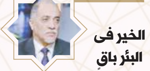
الخير في البئر باق

لا يزال في بئر الخير كثير، والفرصة لا تزال قائمة، والسوق لم تنفص، فلنساهم بالجد والاجتهاد في الأيام المقبلة، فلا يعلم أحد مكان الرضا الإلهي ولا القبول الرباني، فأفكر في جميع أوقاتكم، بالدعاء والنهوض إلى الرحمن الرحيم الذي يحب المضطر إذا دعا، ويقبل عشرة المكروب، ويغيب المكروب، فحينما تلجأ للألئسة بذكره، والقلوب يشكره، تدعوه في الشدة والرخاء، والضرى، وتزغ إليه في الللمات، وتتوسل إليه في الكريات، الطرح أو جاعك إليه، أعاب بالبه ساتلين، باكيا ضارعا متنيا، حينما سيأتك اللمد ويصل إليك العون ويدركك القوة، ويسارع إليك الفرج، ويحل الفرج، سبحانه مجيب المضطر إذا دعا، فيجيب الغريق ويرد الغابج، ويعافي المبني، وينصر المظلوم، ويهدي الضال، ويشقى المرض، ويخرج عن المكروب، فالزموا باب الرجاء واكثروا النداء والطلب، فإذا وجدتم أثر دعائكم سكبنا وطمانينة فقد وجدتم كل خير، إن دعاء ربك عبادة آخرة، وطاعة عظمي، وإذا عرفت سر الدعاء فلا تهتم ولا تفتنم ولا تلتفت، وكل الجبال تصرم إلا حبه، وكل الأبواب توعد إلا بابيه، إنه قريب سميع مجيب، فأمر أن تدعوه فيستجيب، فلا فناء في تلك النوازل، وإلت بك الخطوب، فاهلج بذكره، واهتف باسمه، واطلب مده وأسأله فتحه ونصره، واحصل على تاج الحرية، وسوام النجاة، ومد يدك، وأرفع كفيك، وأطلق لسانك، وأكثر من طلبه، وياعل في سؤاله، وألج عليه، والزم بابيه، وانظر لطمته، وتربق فتحه، واحسن ظنك فيه، واقطع ألبه، وقبيل إليه تبتئلا حتى تسعد وتقلج.