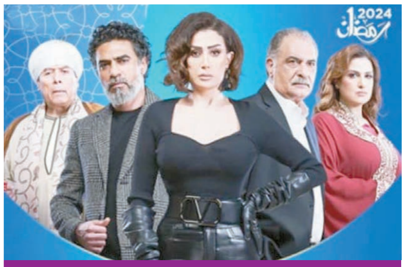
ووغادة عبدالرازق تمارس هواياتها فى «صيد العقارب»