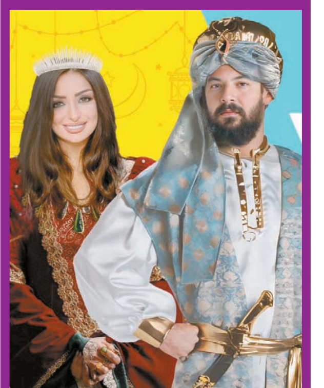
عندما يحكى شهريار.. حكايات جديدة من «أف ليلة وليلة» على «9090»

حرصت الشركة المتحدة للخدمات الاعلامية على ان تقدم مجموعة متميزة من مسلسلات الاطفال خلال شهر رمضان وذلك يعكس حرصها واهتمامها الكبير بوعي وثقافة الطفل فقدمت هذا العام اربعة مسلسلات تنتمى الى اعمال الانيميشن والرسوم المتحركة وتنوع ما بين الدينى والتاريخى والاجتماعى فنجد مسلسل يحيى وكنوز يقدم الجزء الثالث منه بعد ان حقق نجاحا كبيرا فى السنوات الماضية وشارك فيه عدد كبير من نجوم الفن ويتناول المسلسل حكايات الفراعنة وتاريخنا الحضارى الكبير وهو من المسلسلات التي تثير الوعي الكبير لدى الاطفال وتعرفهم بتاريخهم وحضارتهم. كذلك المسلسل الدينى سر المسجد والذي يدعم القيم الدينية لدى الاطفال والتربية الدينية الصحيحة وتعليمهم أسس الدين. ومسلسل نور والكوكب السعيد وهو مسلسل اجتماعى يتحدث عن كيفية الحفاظ على البيئة من حولنا وحب الجميع وحب الزراعة. مسلسل نورة ويتحدث عن قضايا المراهقين وأسس التربية السليمة والعلاقة بين الآباء والابناء.