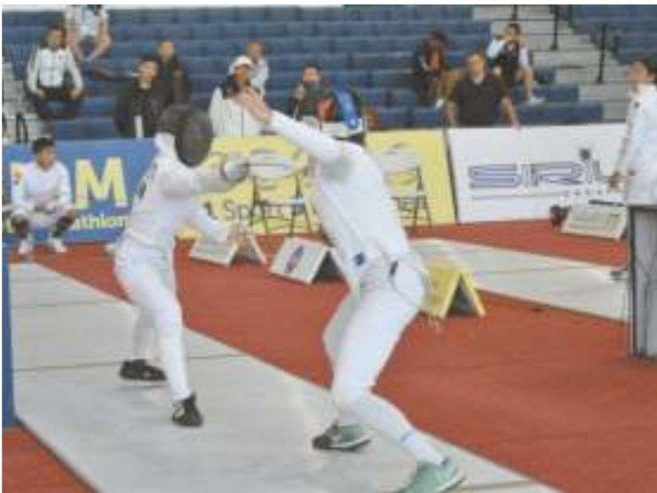
مباراة في بطولة كأس العالم للخماسي الحديث في القاهرة، حيث ان الدول التي تصدرت المنافسات في العام الماضي ما زالت تحتفظ بمكانتها ومستواها في هذه النسخة، مضيفا أن ألمانيا كان من الممكن أن تقدم نتائج أفضل من ذلك، بالإضافة إلى كوريا والصين وكازاخستان قدموا مستويات مميزة.

أضاف أنه لا توجد فرق ومنتخبات بعينها قدمت