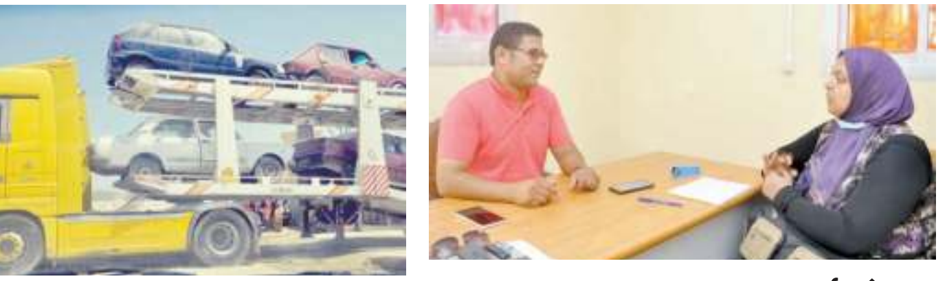
الموقع الإلكتروني أو الخط الساخن ١٥٧٠٧ أو صفحة