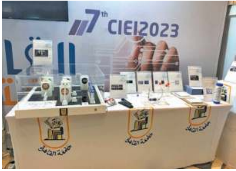
أساتذتها فى التصنيفات العالمية.. وأرقام قياسية فى المشروعات الابتكارية وبراءات الاختراع