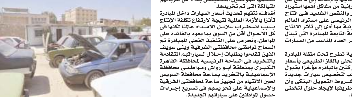
الموقع الإلكتروني أو الخط الساخن ١٥٧٠٧ أو صفحة

إيجابية فى التشغيل تقليل الانبعاثات الكربونية تليق مع الشركات الحد من تلوث الهواء السواجـة والبحيرة الإسماعيلية الشرقية وبنى سويف باقي المحافظات .. قريبا