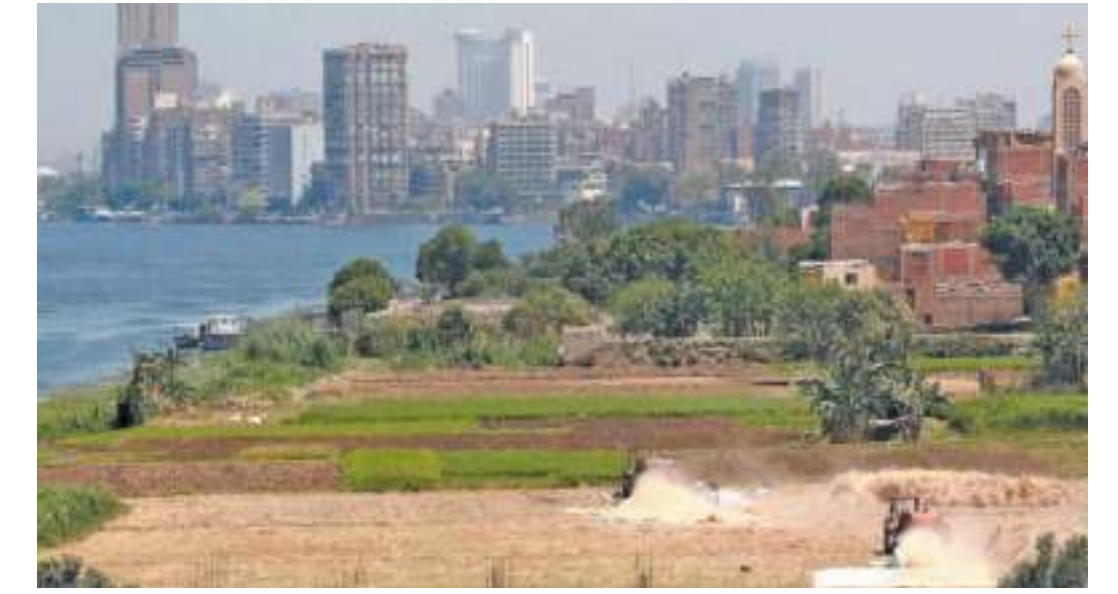
إنتاج فريد.. يحقق عدالة استخدام الموارد الطبيعية.. ويونع مصادر الإنتاج.. وبدعم التنافسية

مع وداع عام، شهد الكثير من الصعاب والأزمات الشديدة إقليمياً وعالمياً.. ونجحت فيه مصر فى عبور الكثير من «الطبات»، ومع استقياى عام جديد، يحمل آميات المصريين بخير واستقرار وأمن وأمان، تتوقف عند «محطات حصاد» جديدة فى الوزارات والهيئات والمؤسسات، وتتعرف على ما حدث.. وفى محطات جديدة، ترصد الكثير من الإنجازات فى مجالات متنوعة، شاهدا على نجاحات الدولة المصرية الجديدة، وهى جزء أصيلى فى بناء الجمهورية الجديدة، وكانت هذه الإنجازات خير معين فى تخطى أزمات صعبة «صعبة»، وكان الرد الشعبى واضحاً وقويا ومؤكدا على وعيه بهذه الإنجازات، عندما خرج ليوكد أن «السيسي» اختيار المصريين» فى الانتخابات الرئاسية، ويختار الشعب «الريسي» لولاية جديدة.