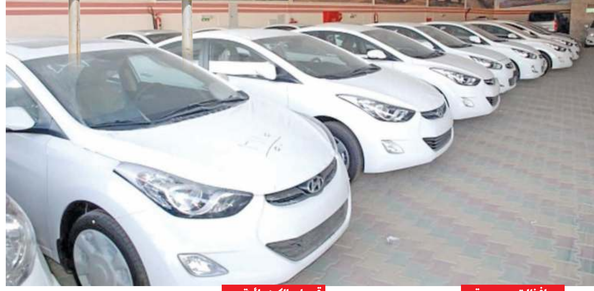
محافظة .. جديدة: قريبا .. الكهربائـة: قريبا ..