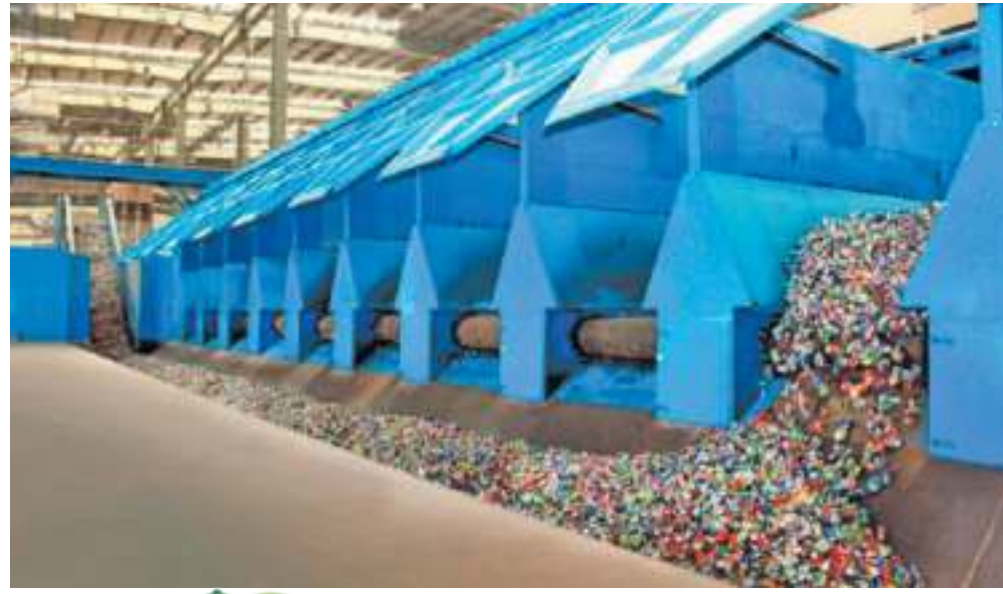
إنجاز فريد.. يحقق عدالة استخدام الموارد الطبيعية.. ويونع مصادر الإنتاج.. وبدعم التنافسية