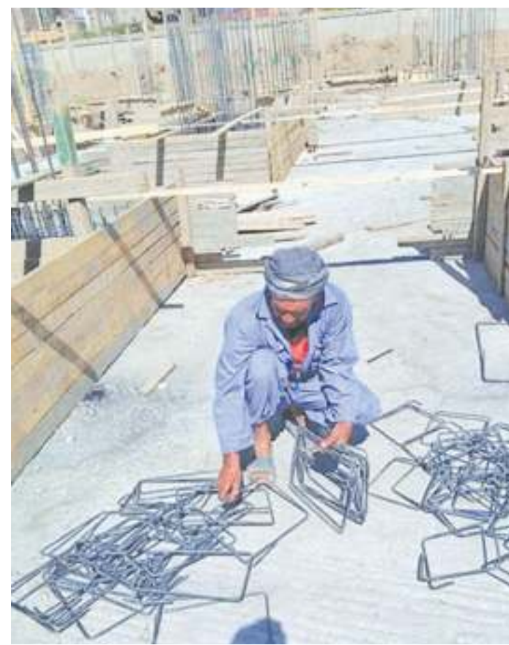
مهنى 2023 .. تجهيزات رأسية - مشروع قومي - مهارات الشباب .. مشاركة القطاع الخاص، المجتمع المدني

قال الدكتور عبدالله جلال عميد كلية التكنولوجيا والتعليم السابق في جامعة سوهاج، ورئيس مركز العاصمة للدراسات الاستراتيجية: إن ما قامت به وزارة العمل من أجل التدريب المهني ٢٠٢٣ للشباب، يحقق لهذا المشروع طفرة هائلة من الناحية الاقتصادية وتحقيق مزيد من التقدم وهناك العديد من التحديات التي تواجه سوق العمل في مصر خاصة في المهن التي يحتاجها سوق العمل، والتدريب بشكل عملي هو أهم تحديات تواجه الشباب وما تقوم به وزارة العمل من توفير مراكز تدريب للشباب، وأضاف أن التعامل بحرفية وإعادة إحياء العديد من المهن لتلبية احتياجات سوق العمل وتحقيق لهم طموحاتهم في التدريب وطبيعة كل حرفة. وأشار إلى أن هذا التدريب سيكون نواة لدعم المشروعات الصغيرة والمتوسطة التي يعتمد عليها العديد من اقتصادات الدول في العالم وتحسين العلاقة الحقيقية للعالمية نحو الأفضل لصالح الوطن وسوق العمل والعمال والاقتصاد الوطني لأن الأيدي العاملة هي العمود الفقري للاقتصاد الوطني في ظل ما تقوم به مراكز التدريب المختلفة. وقال د. خالد إن دور وزارة العمل هائل وقوي من أجل تلبية احتياجات سوق العمل، وأضاف أن هذا التدريب سيكسر نمط العمل في مصر من أجل تحقيق طفرة في حقيقة سوق العمل المحلي والدولي وتنمية مهارات العمالة المصرية وتأهيلهم لسوق العمل خارج ودخل مصر.