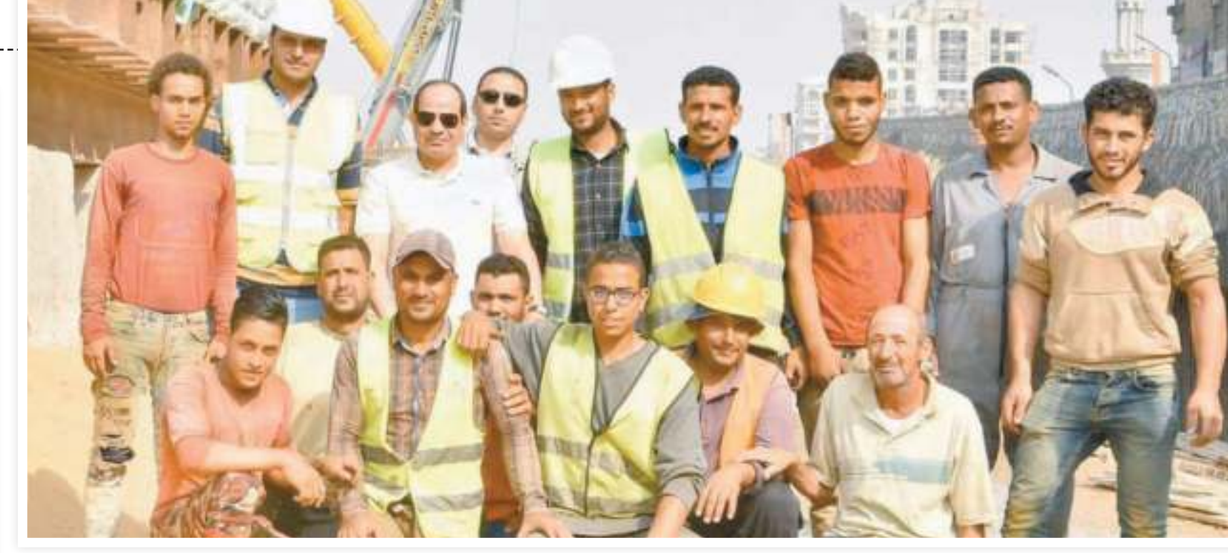
المركز الإعلامي لمجلس الوزراء:

أسباب النجاح الرئيسية.. تبني إستراتيجية وطنية لمواجهة المشكلة.. دعم ثقافة الابتكار وريادة الأعمال.. برنامج الإصلاح الاقتصادي والاجتماعي