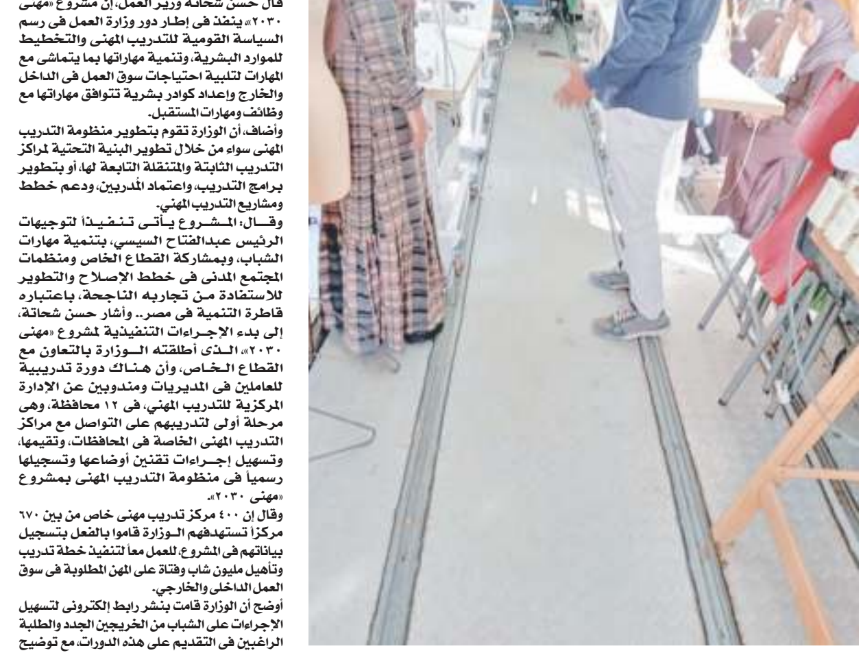
مليون شاب .. مستهدف 400 مركز تدريب خاص .. 670 مركزاً .. الهدف

قال حسن شحاتة وزير العمل في مشروع مهني ٢٠٢٣، ويتخذ في إطار دور وزارة العمل في رسم السياسة الوطنية للتدريب المهني والتخطيط للموارد البشرية وتنمية مهاراتها بما يتماشى مع احتياجات سوق العمل، وفقاً لمتطلبات سوق العمل العالمية، والتي تتطلب من الداخل والخارج إعداد كوادر بشرية تتوافق مهاراتها مع وظائف ومهارات المستقبل. وفي هذا الاتجاه، تقوم وزارة العمل بتطوير منظومة التدريب المهني، سواء من خلال تطوير البنية التحتية لمراكز التدريب الثابتة والمتنقلة التابعة لها، أو بتطوير برامج التدريب، واعتماد المدربين، ودعم خطط ومشاريع التوجيهات المهنية ويأتي مشروع مهني ٢٠٢٣ تنفيذاً لتوجيهات الرئيس عبد الفتاح السيسي بتنمية مهارات الشباب، وبمشاركة القطاع الخاص ومنظمات المجتمع المدني في خطط الإصلاح والتطوير والاستفادة منه والأخذ بنواحي أحلام وطموحات قطاع كبير من الشباب على أرض الواقع. الجمهورية، في جولة جديدة، بين الجديد في الدولة المصرية الحديثة، تتوقف عند التدريب وإعداد الكوادر وفق متطلبات عمصرية في الجمهورية الجديدة، وهذه تفاصيل كثيرة في هذا الملف.