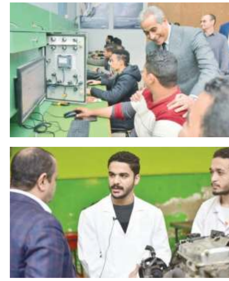
تدريب x مهن مطلوبة: إدارة أعمال وسكرتارية

الشباب .. هدف: تسجيل الدورات - رابط إلكتروني - تسهيل الإجراءات - الشروط المطلوبة