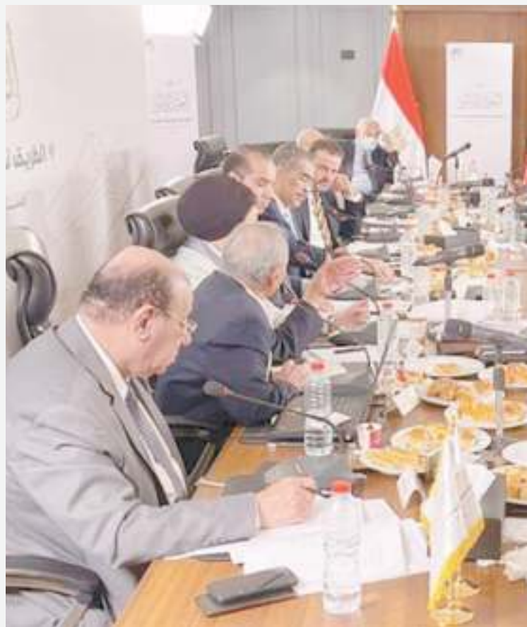
نواب في مجلس الشيوخ:

3 مايو .. انطلاق تنفيذ مبادرة رئاسية «دعت و رعت و استجابت»: مشاركة كبيرة + ملفات متنوعة + رؤى متعددة = مشاركة في البناء و التنمية + رسم خارطة طريق «مستقبلية»