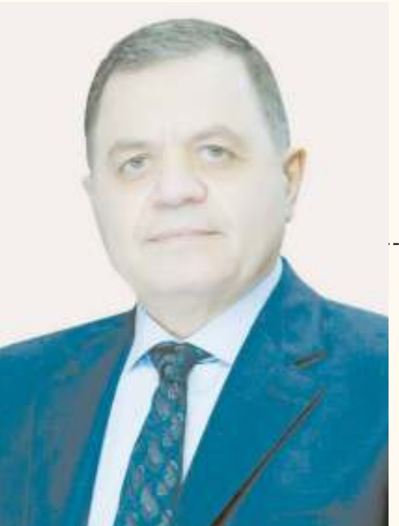
ملف: خالد أمين الإذاع الصحفي: أحمد حمدي

احتفلت مصر أمس الخامس والعشرين من يناير بـ «عيد الشرطة».. واحد وسبعون عاما مرت على ذلك معركة الإسمايلية.. تلك المعركة التي جرت أحداثها في الخامس والعشرين من يناير من عام ١٩٥٢ بين الشرطة المصرية وقوات الاحتلال الإنجليزي في الإسمايلية.. وهناك سجل أولئك الأبطال واحدة من معارك البسالة والصمود والكرامة المصرية.. وسطروا بين صفحات التاريخ «ملحمة» تحتفل بها مصر منذ ذلك التاريخ وحتى اليوم. أكدت الشرطة المصرية وهي تحتفل بمرور واحد وسبعين عاما على معركة الإسمايلية عددا من «الرسائل الشرعية».. وخلال كلمته في الاحتفال الذي أقيم في مقر وزارة الداخلية بجمهورية مصر العربية، أكد وزير الداخلية اللواء محمود توفيق بعودة رسائل شجوة تشيخ إلى ثوابت ومرتكبات أمنية هي أكثر من اتجاه.. وأكدت هذه الرسائل من بين ما أكدته إدراك حجم تحديات اللحظة التي فرضتها ظروف إقليمية وعالمية.. وأنه سجل أولئك الأبطال فضل مهمة حماية أمن الوطن في مقدمة المهام.. بين إشارات تاريخ ملحمة الإسمايلية.. وتحديات محيط إقليمي ودولي وتطلعات وأمال نحو مستقبل مبشر.. بين كل هذا يأتي الاحتفال بـ «عيد الشرطة» هذا العام.. احتفال تضيئه فيه علامات إدراك حجم التحدي وعمق الشعور بأهمية رفع العباء عن كامل المواطنين.. جنبا للطريق..