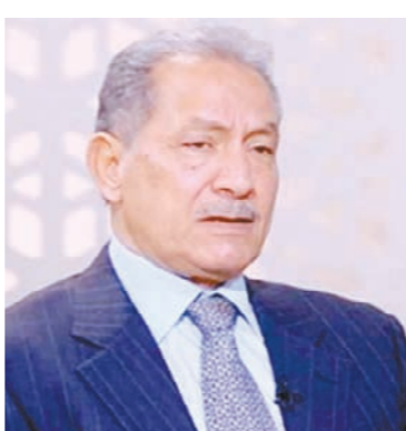
السفير صلاح حليمه