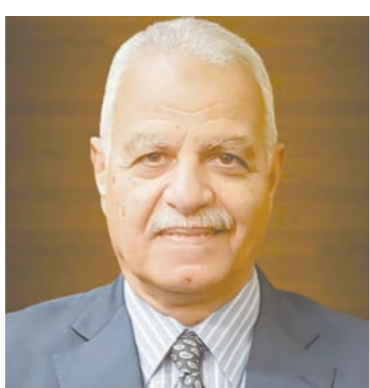
الواء محمد إبراهيم

وأكد السفير مشرفة أن المقال يظهر التعاون الاستراتيجي بين مصر والأردن وفرنسا ويؤكد على الدور المحوري للوساطة المصرية، وفرنسا كعضو دائم في مجلس الأمن ودورها المؤثر في محيطها الإقليمي.