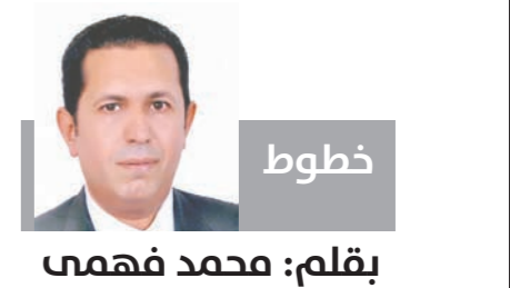
بقلم: محمد فهمي

وأكد السفير مشرفة أن المقال يسلط الضوء على أهمية فتح كافة الممرات في القطاع لعبور المساعدات الإنسانية دون قيد أو شرط وحرصاً من الجماعة واستخدام سلاح العطف ضد سكان القطاع.