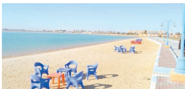
الحدائق والشواطئ العامة خلال إجازة العيد وتكثيف أعمال النظافة ورفع المخلفات صباحا ومساء.

السويس - صابر الجندي وسماح صاير: قال اللواء عبدالجديد مقتر محافظ السويس على رفح درجة الاستعداد القصوى لجميع المرافق الحيوية والصالح الحكومية والتأكد على تنفيذ كافة الإجراءات التى اتخذتها الدولة لراحة وتأمين المواطنين خلال إجازة عيد الفطر المبارك. وأكد المحافظ على جميع المديرية والصالح الحكومية والمرافق الحيوية بإلغاء الاجازات واستمرار المتابعة على مدار الساعة لجميع المرافق والخدمات