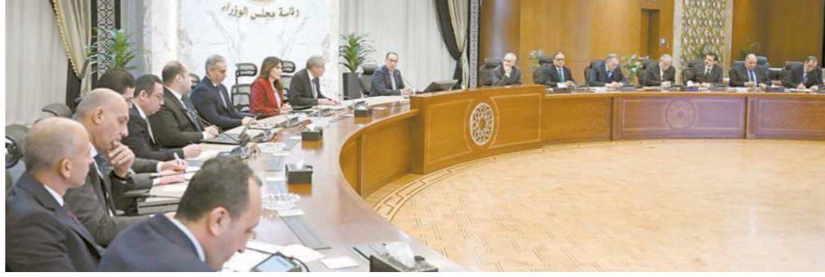
رئاسة مجلس الوزراء

أكد الدكتور مصطفى مدبولي رئيس مجلس الوزراء أنه كنتيجة للخضوع للتقارير التي قامت بها الحكومة بالتعاون والتنسيق الكامل مع البنك المركزي، وبالإفراج الجمركي عن مختلف المنتجات، وبالتالي أصبحت السلع متوافرة في الأسواق، تمهيدا لحدوث توازن في أسعارها. جاء ذلك خلال الاجتماع الذي عقده الدكتور مصطفى مدبولي، رئيس مجلس الوزراء، لمناقشة إجراءات زيادة العروض من السكر في الأسواق. أشار مدبولي إلى أن هذا الاجتماع يستهدف متابعة توافر السكر في الأسواق، مشيرًا إلى أن الدولة تعمل حاليًا على سد أي فجوة في هذه السلعة، مؤكدة جاهزية الحكومة جنيًا إلى جنب مع البنك المركزي، لتدبير موارد النقد الأجنبي المطلوبة لاستيراد مليون طن من السكر، مبينًا أن الدولة اتخذت إجراءات الاستيراد، وبدأت بالفعل بعض الشحنات في الوصول، حتى لا تكون هناك أي فجوة في هذه السلعة، مشيرًا إلى أن الندرة في السلع تخلق أكثر من سعر لهذه السلع، وهو ما نعمل على مواجهته. أضاف رئيس الوزراء أننا نتابع الأسواق ونعرف أن هناك مشكلة في توافر السكر بأسعار مناسبة، ولكن نعمل على حل تلك المشكلة، لدينا بالفعل خطة لعلها بأسرع وقت. خلال الاجتماع عرض الدكتور مصطفى مدبولي، وزير التموين والتجارة الداخلية، موقف منظمة التعاون الإسلامي لعام 2024، حيث تطرق إلى جهود تهيئة السوق، في مقابل حجم الاستهلاك، مشيرًا إلى أنه تم البدء بالفعل في إجراءات التعاقد على استيراد 200 ألف طن من السكر، ووصل منها بعض الشحنات. كما تناول الوزير تفاصيل خطة إنتاج السكر والتدفق المقترح بالأسواق، مؤكداً أن خطة العمل في هذا الإطار تقوم على إيجاد توازن بين سعر المستهلك سواء تجارياً أو صناعياً.