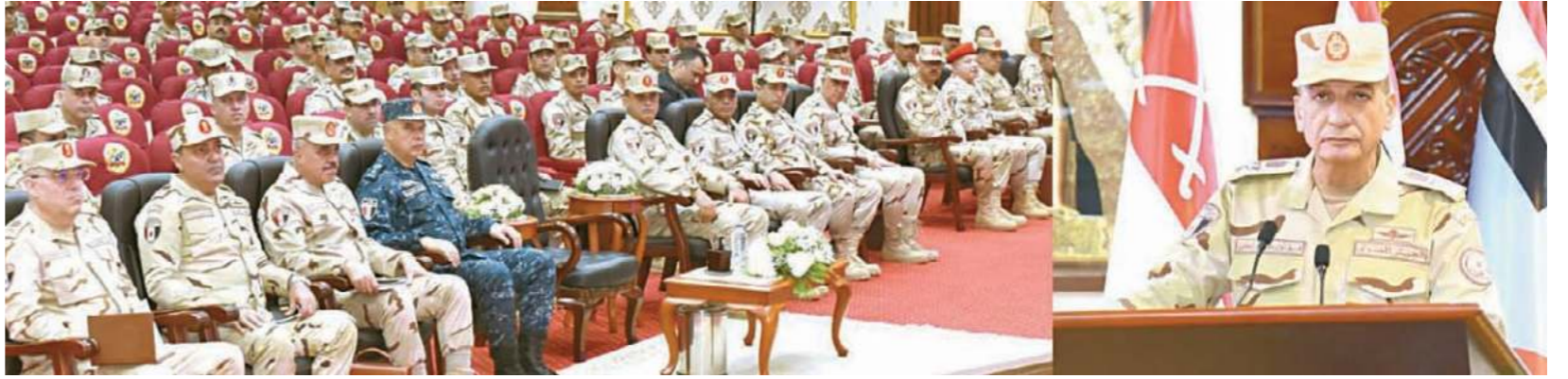
الفريق أول محمد زكى: