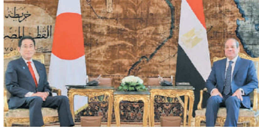
لقاء فخامة الرئيس عبدالفتاح السيسي مع رئيس وزراء اليابان كيشيدا فوميو

ومع نهاية الحرب الباردة، كانت اليابان أولى دول العالم التي تطلق منبراً خاصاً بالتنمية في إفريقيا وهو مؤتمر طوكيو الدولي للتنمية في إفريقيا «تيكاد» وذلك في عام ١٩٩٣. ويتلخص المفهوم الأساسي لمؤتمر تيكاكاد في دعم المجتمع الدولي لـ «ملكية» البلدان الأفريقية من خلال «الشراكة». ومنذ ذلك الحين، وعلى مدى ٣٠ عاماً، وقعت اليابان دائماً على جانب التنمية في إفريقيا باعتبارها شريكاً للتنمية في القارة. وخلال قمة مؤتمر طوكيو الدولي السابع للتنمية في إفريقيا «TICAD7» في نوفمبر ٢٠٢٣، وافقت اليابان «أثناء» أي، ومن المقرر عقد القمة التاسعة للمؤتمر في اليابان العام القادم. ومن سمات الشراكة التنموية اليابانية أنها تهدف إلى تحقيق مجتمع يحترم حياة الإنسان وسبل عيشه